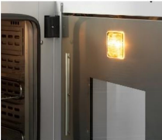
نصب لامپ در صورت سفارش