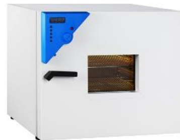
نصب درب شیشه ای با قاب فلزی جهت مشاهده محفظه داخلی در صورت سفارش