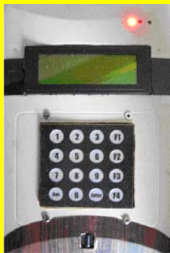
سیستم کنترل جدید

تردمیل های حیوانی دارای دو بخش مجزای مکانیکی و کنترل می باشد. در گذشته کلیه مدل های تردمیل ساخت شرکت پیشرو اندیشه صنعت بوسیله سیستم کنترلی تابلو برقی کنترل می شدند ولی در سالهای اخیر بدلیل بالا بردن سیستم امنیتی و قدرت کنترلی به سیستم های جدید کنترل روی آوردیم. در ادامه با جزئیات این دستگاه آشنا خواهید شد.