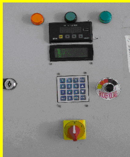
سیستم کنترل قدیم