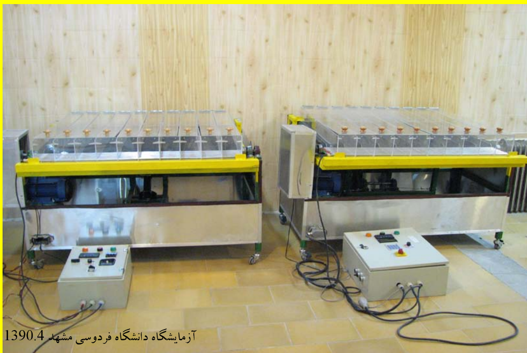
آزمایشگاه دانشگاه فردوسی مشهد 1390.4

شرکت پیشرو اندیشه صنعت تنها سازنده تردمیلهای حیوانی در ایران و دارای گواهی ثبت اختراع با سابقه چندین ساله ساخت دستگاه های آزمایشگاهی مشغول خدمت رسانی به جامعه علمی کشور می باشد.