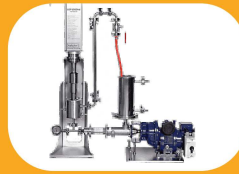
انحلال ذرات رنگ در محلول‌ها