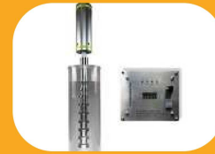
هموژنایز کردن لبنیات عصاره گیری گیاهان دارویی