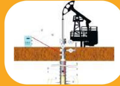
بازیابی چاه‌های نفتی