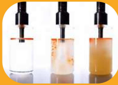
همگن سازی نانوذرات