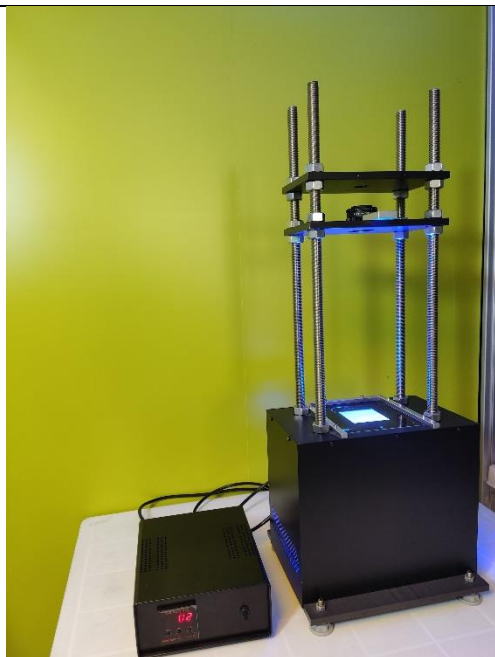
مدل KAL5 با ضریب ثابت

مدل KAL5 با ضریب ثابت و KAL5,7 با ضریب متغیر