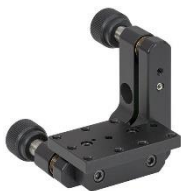
نگهدارنده قابل تنظیم منشور

مشاهده صفحه این محصول در سایت شرکت پلاریتک