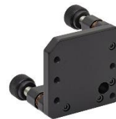
صفحه نگهدارنده قابل تنظیم ۲*۲ اینچ