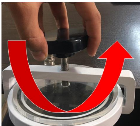
شکل ۱. باز کردن درب جار

پیچ بالای دستگیره را مطابق شکل ۱ در جهت خلاف عقربه های ساعت بپیچانید. لازم نیست کل طول پیچ از داخل دستگیره خارج شود. مطابق نیاز پیچ را شل کنید.