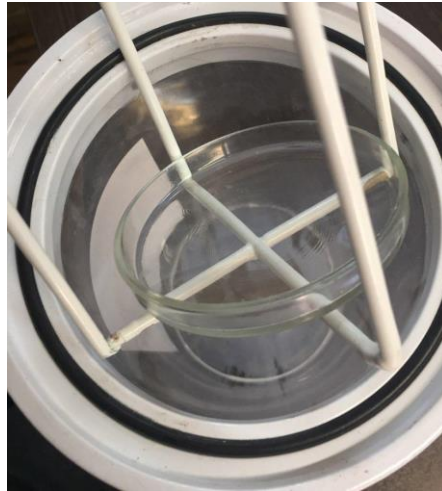
شكل ۲. محل قرار گیری پتريدش در رگ درون جار

مطابق شكل ۲ به تعداد دلخواه می‌توانید ظروف آزمایشگاهی را درون رگ جار قرار دهید. در صورت نیاز می‌توانید رگ را خارج کنید.