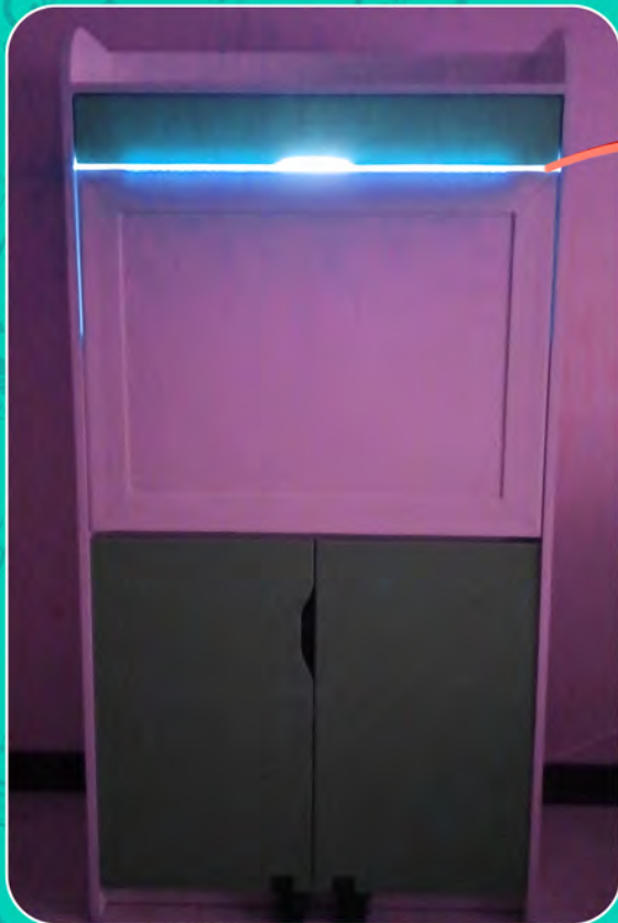
۴- چراغ خواب

۴- برای استفاده از روشنایی میز به عنوان چراغ خواب، صفحه‌ی میز کار را در حالت بسته قرار داده و نور روشن باشد.