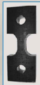
ISO 6259-3 Type 3