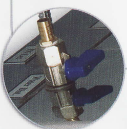
WATER DISTILLATION APPARATUS