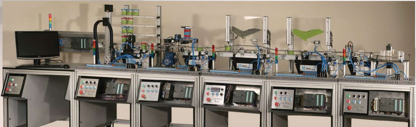
مدل : MIA01

اتوماسیون صنعتی شاخه ای از فناوری است که به کمک آن سیستم های صنعتی خودکار می شوند. این امر به طور طبیعی موجب افزایش سرعت و دقت در اجرای فرآیندهای صنعتی و بهره‌وری اقتصادی می‌شود. به دلیل ضرورت تربیت نیروی انسانی ماهر در حوزه اتوماسیون صنعتی شرکت صنایع آموزشی اقدام به طراحی و تولید مجموعه آموزشی اتوماسیون صنعتی کرده است.