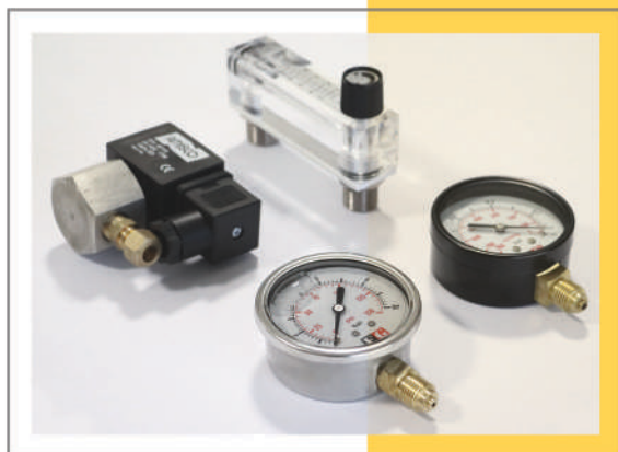
در صورت نیاز به پایلوت‌های تخصصی با ما تماس بگیرید