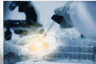
دستگاهی قدرتمند و قابل اعتماد برای حل چالش های علمی