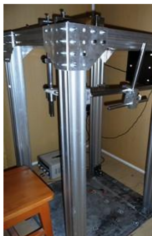
تصویر گرافیکی صندلی میمون و چارچوب تثبیت صندلی میمون