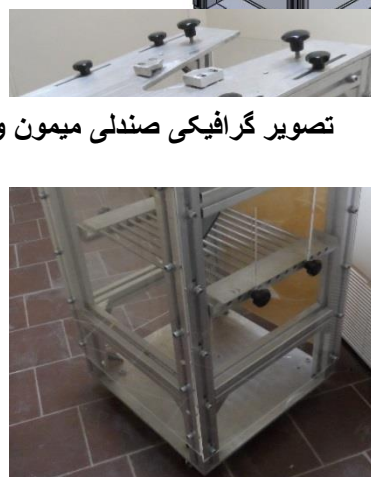
صندلی میمون و چارچوب تثبیت صندلی میمون