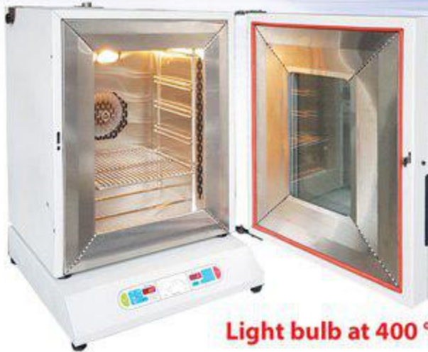
Light bulb at 400 °C