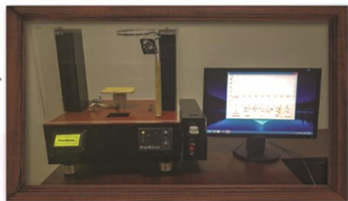
سامانه تست و کالیبراسیون حسگر مقاومتی گاز رومیزی