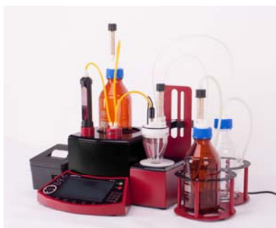
دستگاه تیترا تور کارل فیشر