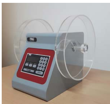
دستگاه تست فرسایش قرص