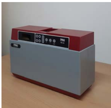
دستگاه سختی سنج قرص