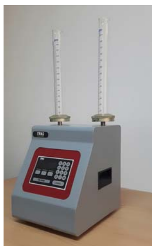
دستگاه تست چگالی متراکم