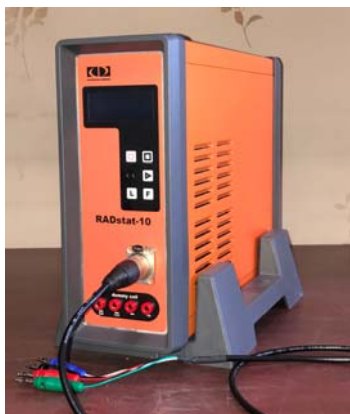
سیستم پتانسیواستات / گالوانواستات امپدانس آنالایزر