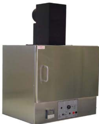
دستگاه شبیه ساز نور خورشید