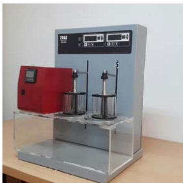
دستگاه تست فروپاشی قرص