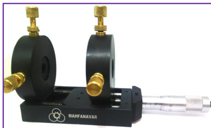
[SFM002]: Spatial Filter Holder