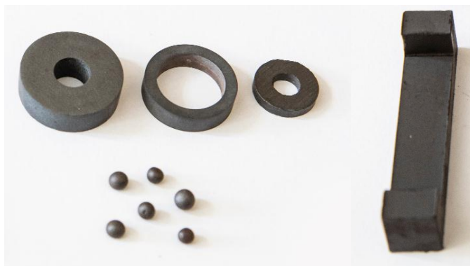
اشکال مختلف فریت‌های تولیدی