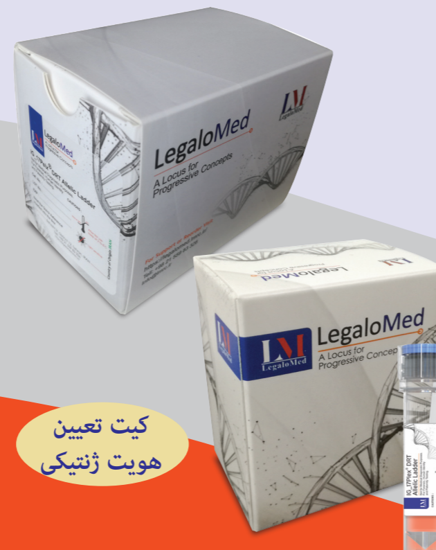
کیت تعیین هویت ژنتیکی