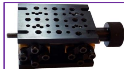
[LJ411]: Mini Lab Jack