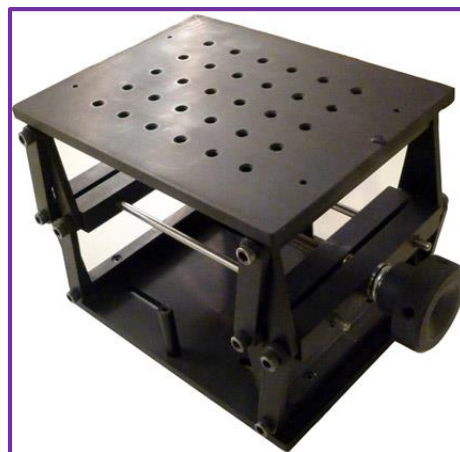
[LJ811]: Lab Jack